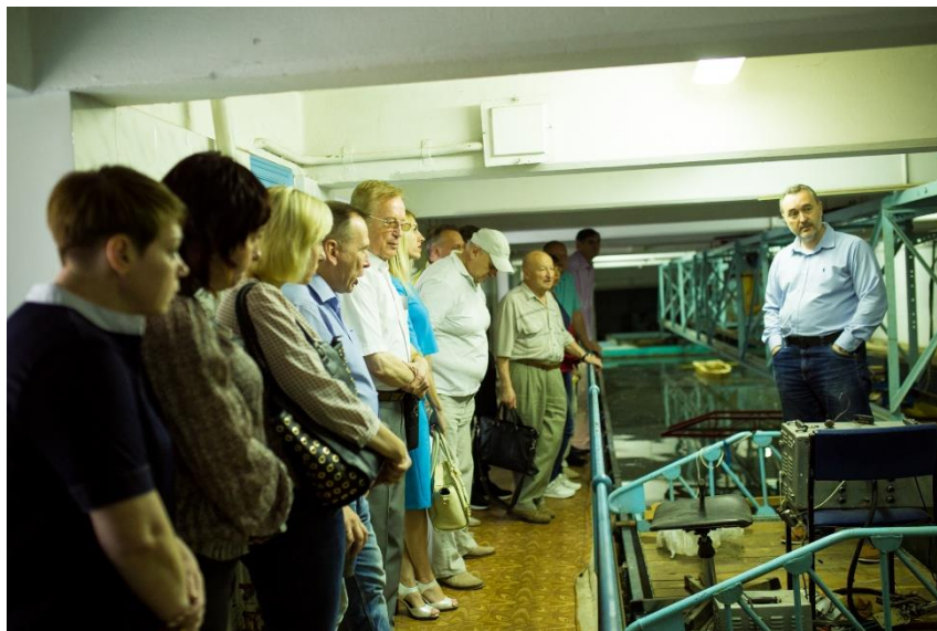
Дослідницький басейн імені професора Костюкова О.О. ОНМУ