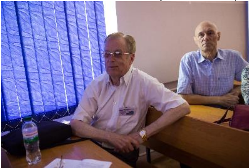
Могила В.І. к.т.н., проф. СНУ ім. В.Даля