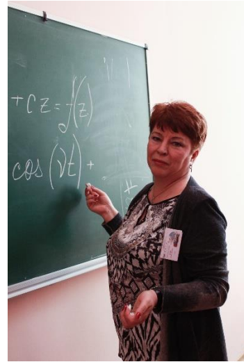
Дискусії в секціях